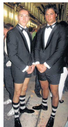
Tenue de L'Homo .