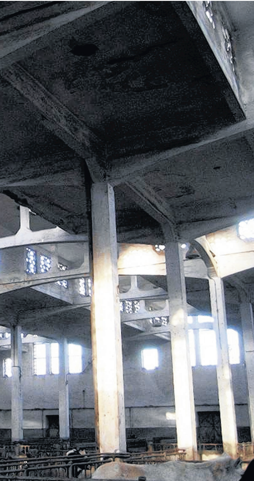
...muzikanten, dansers en andere creatievelingen de weg naar binnen gevonden'.