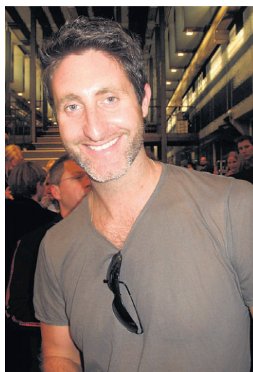
Holland's Next Top Model-fotograaf Philip Riches maakte een serie met een Engels model.